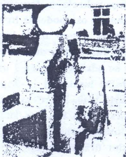
VRELO BARTOLOVAC U HRASTOVCI ODMARALISTE SVAKOG PUTNIKA

Poslije kraćeg zadržavanja, napuštli smo vruć malo mjesto, koje je obr- ađeno bogatim i dobrim vinogradima, u koje posjećuje mnogo turista. Pro- lazimo dalje prekrasnim predjelom Klinac Gore, da nam prvoćemo prugu, koja vodi u Petrinje u Kralje- vac. Kraj je šumovit. U selu Tješnjak nalazi se ruinski zračniti ručac i na- go brzo ostarjelo. Pokraj nas, u bre- govoj nožnji, ostajemo dugo i levo, lijevo, dnovala jebnika, a nakon dolazimo do mjesta, gdje se odnaja put za Bos. Noel. U neposrednoj bli- zini vidimo i šumariću, gdje izlaze Petrinjaca.